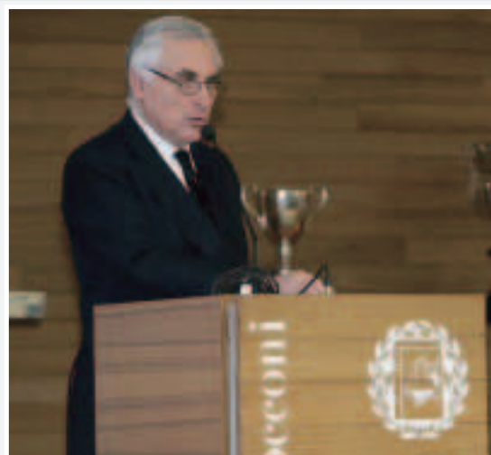
Carlo Croce è uscito trionfatore dalle elezioni primarie